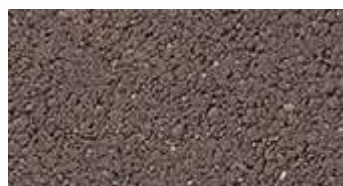
TESTA DÌ MORO